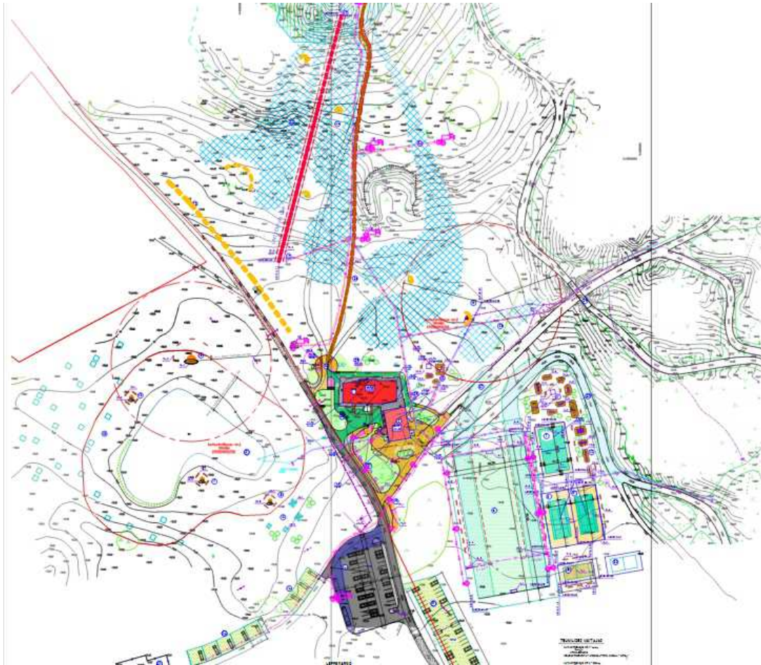
Joonis 1. Taotluses esitatud asendiplan (taotluse fail "test4.oxps"). Tõstuk märgitud punase joonena.